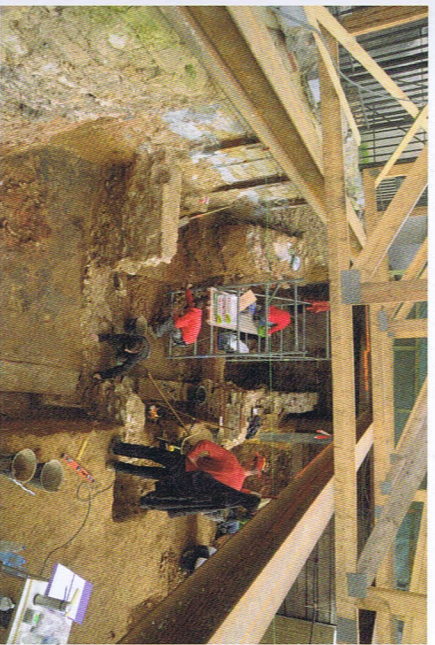
Het Tongerse Vrijthof tijdens de opgraving

De woning was opgetrokken uit dikke stenen muren die de basis vormden voor lemmen wanden. Van de vier bouwfases waren alle wanden echter ingestort en meestal afgedekt met brandlagen en ingestorte daken. Elke bouwfase bestond dus uit een vloer met daarop een dik pak leem, gevolgd door een pakket van verbrand hout en fragmenten dakpan. Bij de aanvang van een nieuwe bouwfase werd rechtstreeks bovenop de ingestorte lagen gebouwd, waardoor de oude sporen goed bewaard bleven. Vaak waren de binnenwanden van de lemmen muren van Romeinse woningen beschilderd met felle kleuren en soms ook met figuren. Ook op het Vrijthof werden vele stukjes van zulke muurschilderingen of fresco's gevonden, vermengd met de leempakketten en de brandlagen. Uit de jongste bouwfase werd een zeer groot stuk van een der-