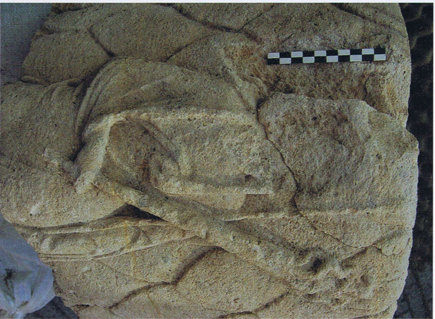
Detail van de kleinere zuiltronnmel met afbeelding van de godin Juno