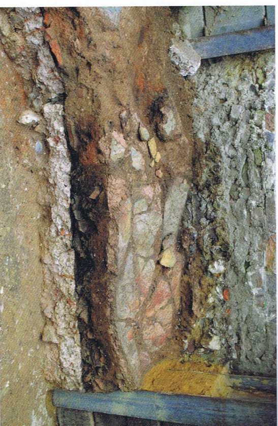
Groot fragment muurschildering bovenop de brandlaag en mortelvloer

ning te herkennen, alle daterend in de 2de en 3de eeuw n.Chr. In combinatie met de oudere opgravingresultaten uit de basiliek weten we dat het gehele gebouw in opbouwperiode ooit groter was dan de kerk zelf. In de laat-Romeinse periode werd een groot deel van Tongeren door branden vernield en bleef er slechts een klein deel van de woning rechtstaan. Een deel van deze woning, opgegraven onder