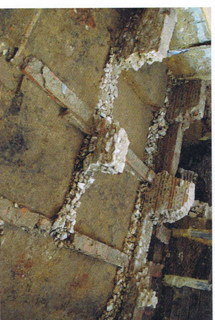
Het laatste opgravingsvlak met verschillende muren van de Romeinse woning