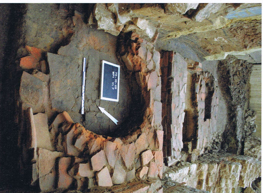
De keukenstructuur met vooraan de oven opgebouwd uit dakpanfrag- menten

de basiliek, bestond uit een rechthoekig zaaltje met een apsis , een halfronde nisvormige ruimte aan de korte zijde. Het was deze zaal die doorheen de tijd zou evolueren van een Romeinse basilica , of burgerlijke vergaderzaal, naar een vroegchristelijke kerk en uiteindelijk de huidige basiliek.